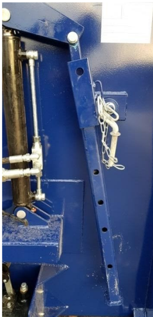
Kuva 3: Kannen lukitustanko

Mikäli kontti on varustettu rei'itetyllä kannen lukitustangolla, voidaan kansi lukita valinnaiseen kohtaan (Kuva 3). Kannen ja lavan väliin ei saa mennä koskaan.