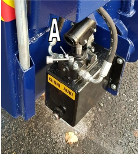
Kuva 1: Pumpun käyttövivusto