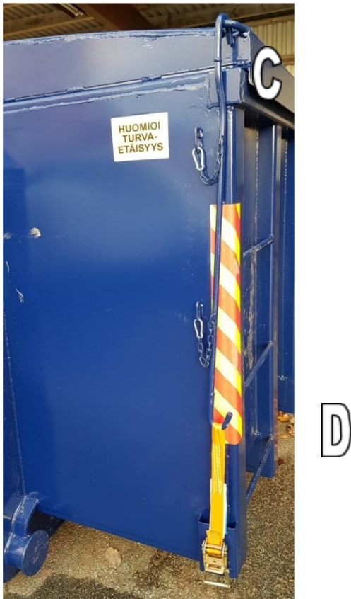
Kuva 4: kannen lukitus

Sulkeminen: Käännä vipu (A) kohtaan ”KIINNI” ja pumpppaan nostotangon avulla (B), kunnes kansi on kokonaan kiinni ja kansi on vasten lavan yläreunaa (C) Lukitse kontin kansi kannenlukitsimella (D) (kuva 4). Tarkasta ennen sulkemista onko kansi lukitustangon varassa. Nosta kantta vapauttaaksesi lukitus.